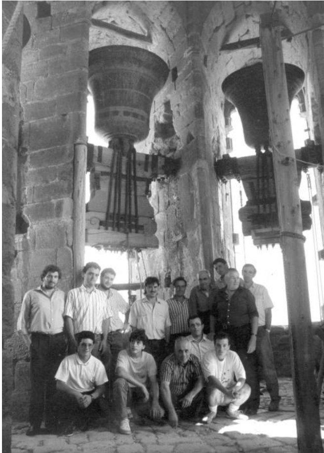
Foto: Arxiu dels Campaners de Cervera, c.1990 Publicada per "Lo Carranquer" Font: D. Vilarrubias