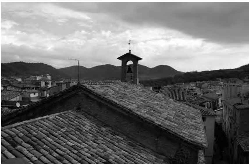
Teulat del Santuari del Tura d'Olot amb la campana fosa l'any 1920 que va substituir la campana Martina