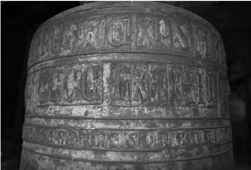
Detall de la campana Martina

La Martina va ser col·locada en un petit campanar d'espadanya que