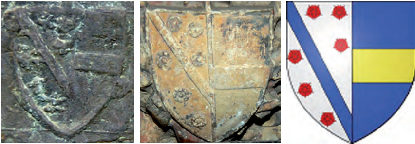
Les armes de la Jugie figuren a la campana d'Olot i el seu sepulcre a la catedral de Narbona. La comparació amb una representació heràldica moderna és ben eloqüent.

il·luminada del llibre pontifical que vers 1350 manà miniar ell mateix, i que es conserva al tresor de la catedral de Sant Just: l'arquebisbe de la Jugie, amb la mitra corresponent, beneeix una gran campana, amb notables similituds (malgrat la distància temporal i la representació pictòrica) amb la conservada a Olot. 13