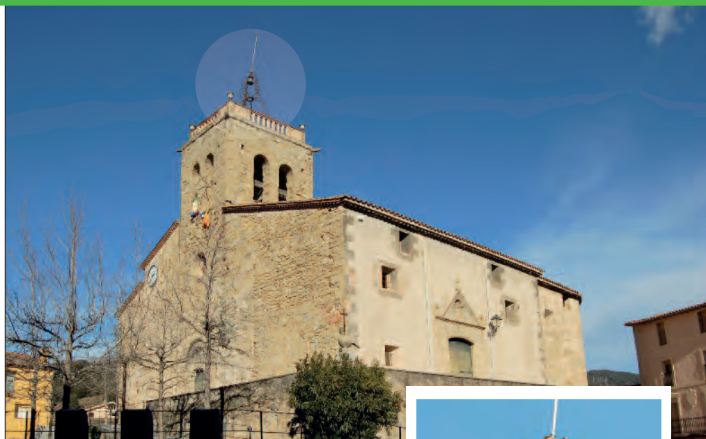
Església parroquial i campanar de Sant Esteve d'en Bas.