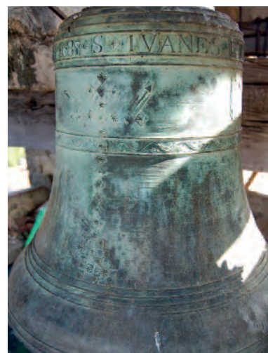
Campana de 59,5 centímetres de diàmetre atribuïble als càntabres Corrales. Amb les inscripcions: "S[ANC]T[E] IVANES ET S[AN]CTA BARBARA ORATE PRONOBIS", "AN[N]O 1685"