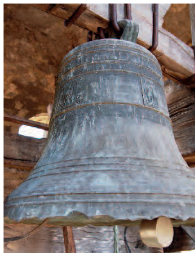
Campana de 54 centímetres de diàmetre fosa pels olotins Calsa l'any 1668. Amb les inscripcions: "AVE MARIA GRACIA PLENA DOMINVS TECVM", " S[ANC]T[E] PONSE ORA PRONOBIS", IO[A]N BA[P]T[SITA] SARAT M[E] F[ECIT]".