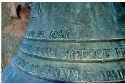
Detall de la campana Josepa. Fosa l'any 1941 a la foneria Barberí d'Olot. (Autor: Xavier Pallàs)