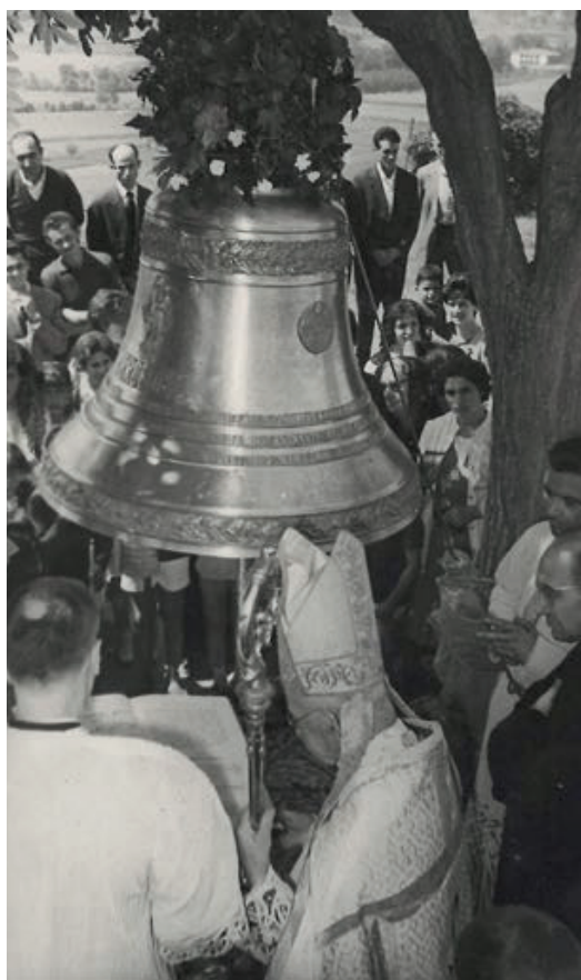
Cerimònia de bateig de la campana Mercè, oficiada pel bisbe de Girona, Josep Cartaïà, davant l'església del Mallol el dia 19 d'agost de 1962. (Arxiu: Puigvert Crehuet. Autor desconegut).