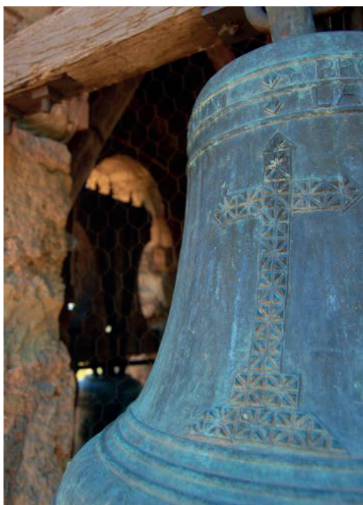
Campana de Sant Just. Feta l'any 1847 per Rafel Barberí. (Autor: Xavier Pallàs)