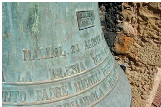
Detall de la campana Miquela. Fosa l'any 1941 a la foneria Barberí d'Olot.

ja que de moment no se n'ha trobat constància documental. L'única referència bibliogràfica ens l'aporta Joaquim Danés en el seu Pretèrits Olotins , on esmenta que, abans de la Guerra Civil (1936-1939), les quatre campanes del Mallol eren fetes per la foneria Barberí d'Olot. 9 Això les situa cronològicament al segle XIX o a principis del XX. Una d'elles fou feta l'any 1888 i, tal com en deixa constància la premsa de l'època, fou la que va fer guanyar als Barberí la medalla d'or a l'Exposició Universal de Barcelona.