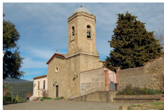
Campanar de Sant Bartomeu del Mallol. (Autor: Xavier Pallàs)

De les antigues campanes del Mallol no en sabem gairebé res,