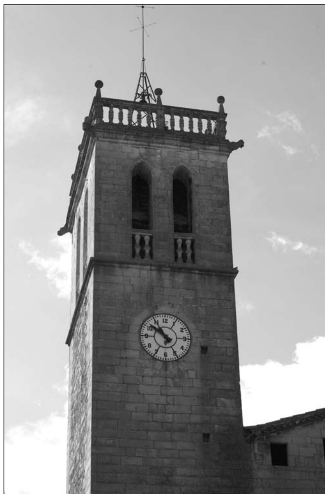
Campanar de Sant Feliu

• La segona consisteix a treure l'electromall de l'interior de la campana gran i posar-lo de forma exterior. D'aquesta manera es podria tornar a col·locar l'antic batall, que encara es conserva a la sala de campanes. Aquesta proposta permetria