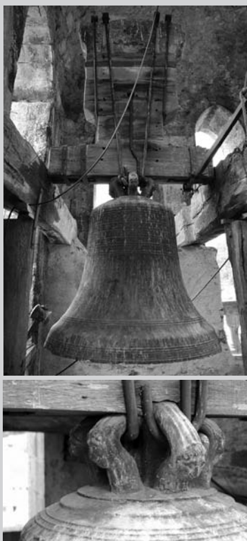
Nanses decorades amb el cap d'un feli