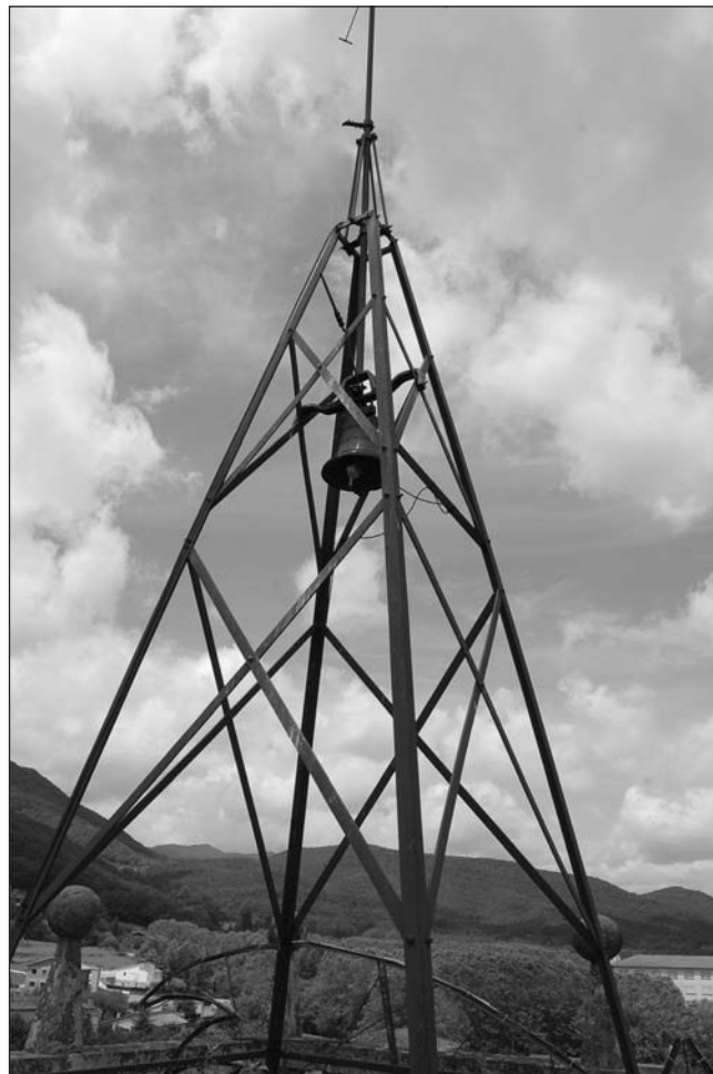
Estructura metàl·lica del terrat amb la campana del rellotge

A part de ser un dels elements arquitectònics més emblemàtics d'un poble, els campanars són també uns edificis vius, amb veu pròpia, que conviuen i es comuniquen amb la resta de veïns a través de les seves campanes. En el campanar de Sant Feliu de Pallerols, n'hi havia hagut cinc: una al terrat i quatre a la sala de campanes, dues de grans i dues de petites. Les de la sala de campanes estaven col·locades damunt una instal·lació de bigues de roure que encara avui es conserva i que ens permet saber la seva disposició. Actualment, però, en el campanar només queden dues campanes. Segons el testimoni del santfeliuenc Salvador Rabat, durant l'inici de la Guerra Civil, al juliol de l'any 1936: van tirar daltabaix del campanar les dues campanes petites, una va quedar enfonsada en el terra de la plaça que, en aquell temps, no era pas empedrat com ara. La grossa la van desmuntar, van treure el contrapès de fusta i la van tirar daltabaix, però no va caure pas al carrer: va caure dins l'església mateix 1 .