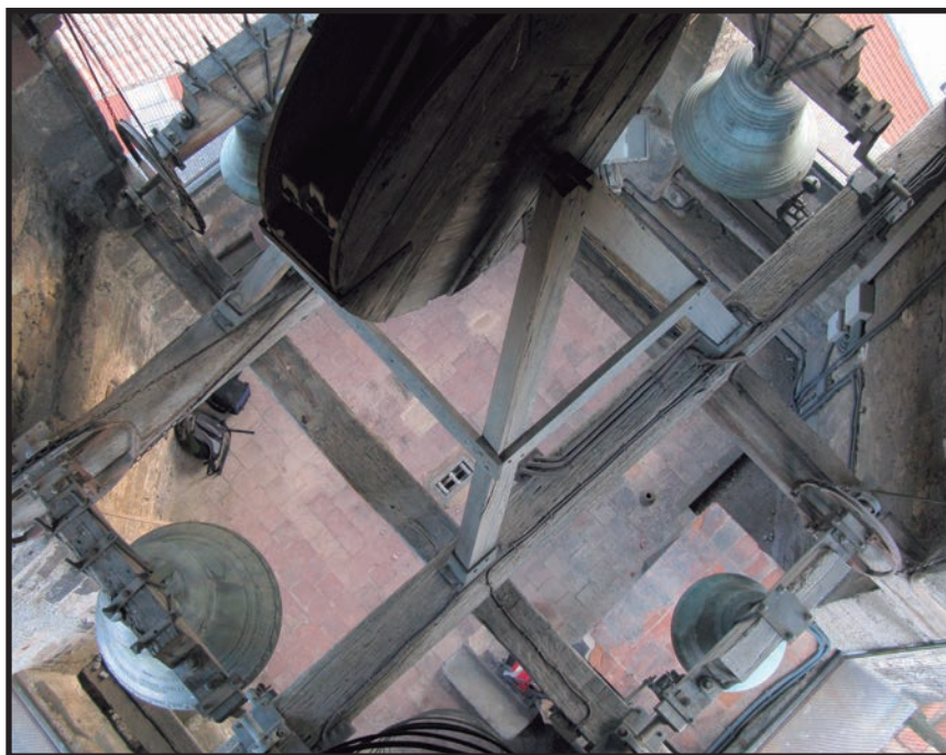
Sala de campanes del campanar de Sant Esteve d'Olot.

no, es feien tres batallades amb la campana grossa, després dues i finalment una. Per tocar a doctrina es feia el mateix però amb la campana nova.