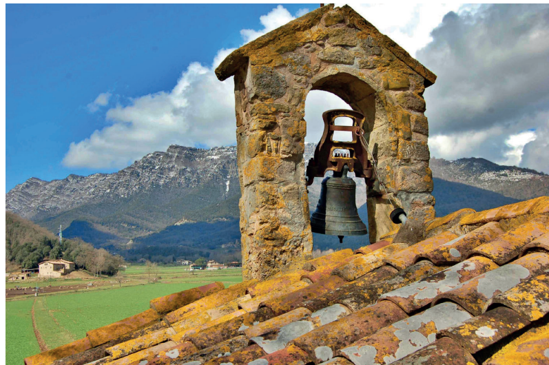
La campana de Sant Quintí i el mas Mercadal al fons.