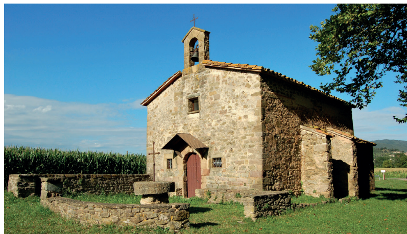
Sant Quintí d'en Bas a l'actualitat amb el seu petit campanar d'espadanya d'un sol ull, on hi penja la campana des de l'any 1979.

La col·lecta per a la campana va tenir èxit i es van aconseguir els diners necessaris per a encarregar-ne la fosa a Can Barberí d'Olot. En Miquel Fluvià els custodiava juntament amb una nota que deia: « Es fondo de San Quintí, es la meva capta extraordinària. Es fondo per posar la campana a l'ermita. » [Can Barberí d'Olot durant l'any 1979.]