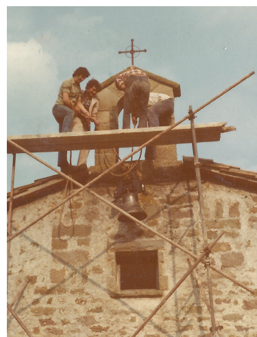
Moment en què col·loquen la campana a l'espadanya.