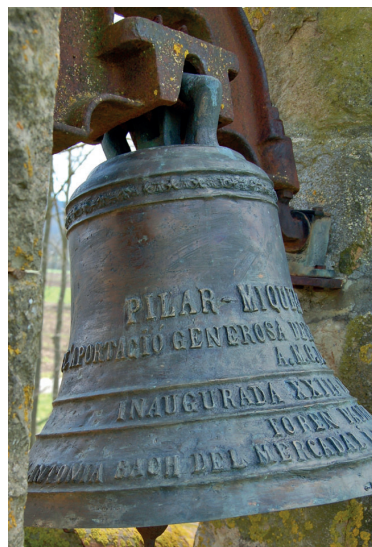
La campana de Sant Quintí mesura 45 cm de diàmetre i té un pes aproximat de 52 kg. Fou fosa a Can Barberí d'Olot l'any 1979.

de Bas, el bisbe les uneix en una de sola. 2 Si bé no queda clara la data en què perdé la independència parroquial, tots aquests documents demostren la penúria d'aquesta església que ni tan sols disposava de casa per al rector.