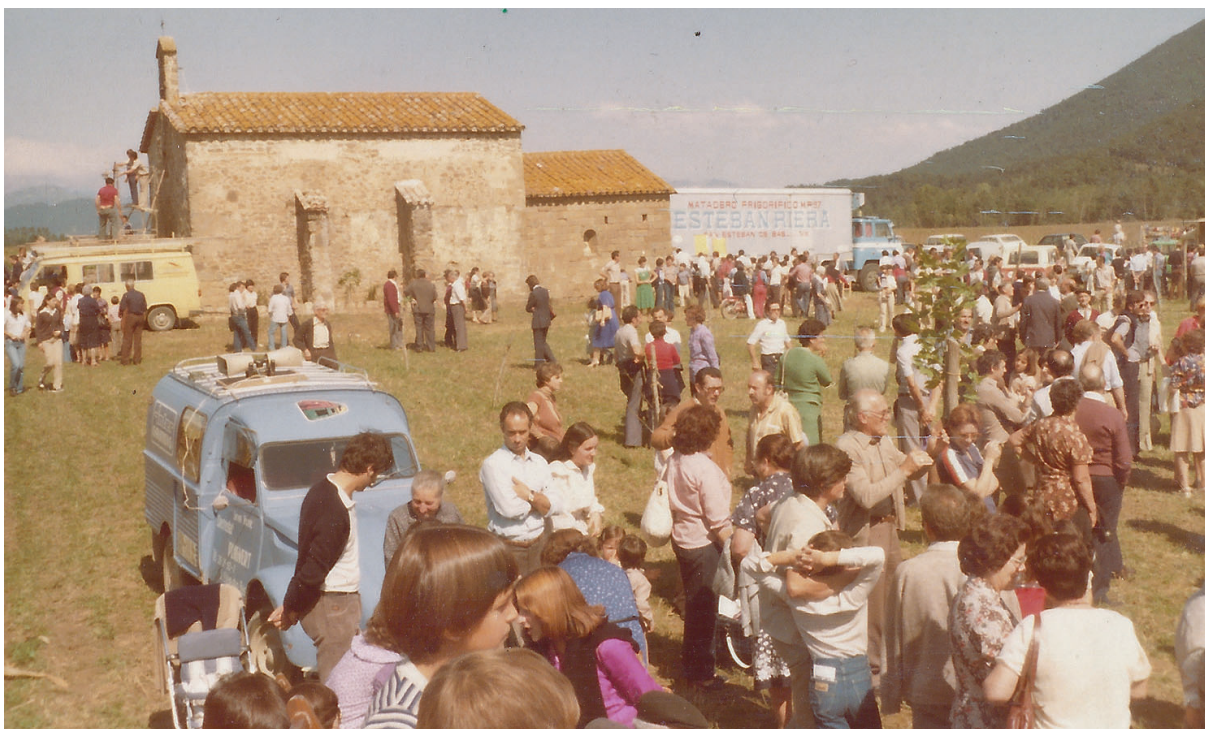
Vista general de l'aplec de Sant Quintí, també es van plantar els plataners al Prat.