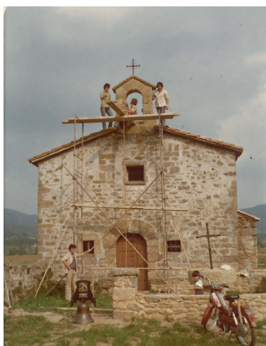
Veïns del barri de Sant Quintí a punt per col·locar la campana.