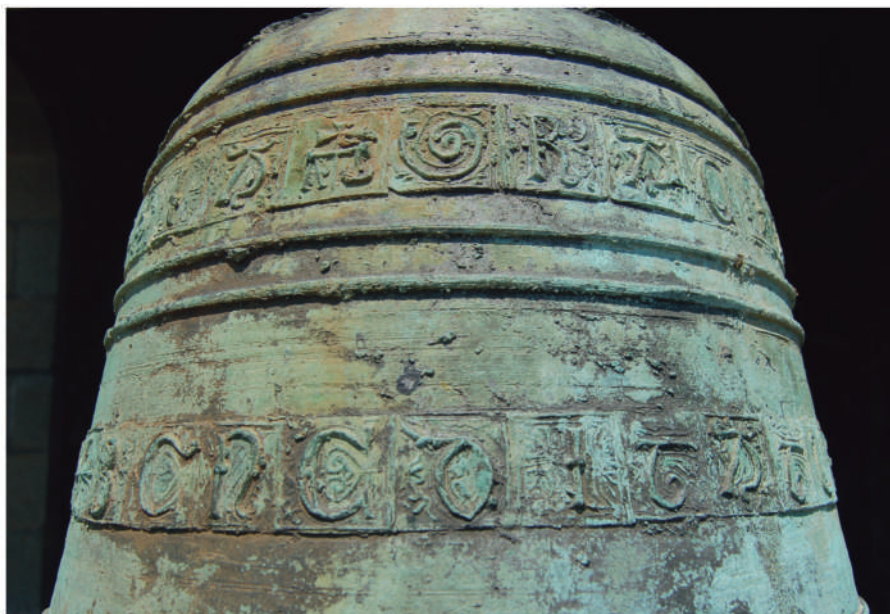
Detall de la campana petita dels Hostalets d'en Bas, on es pot llegir en caràcters gòtics part de la inscripció: «AVE MARIA GRACIA PLENA DOMI[N]VS TECVM BENEDI[C]TA TV IN MVLIERIBVS».