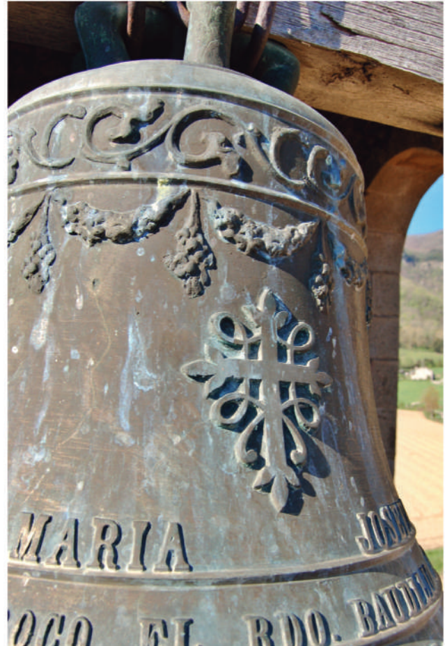
Detall de la campana gran dels Hostalets d'en Bas, on es pot llegir part del seu nom: «MARIA JOSEFA».