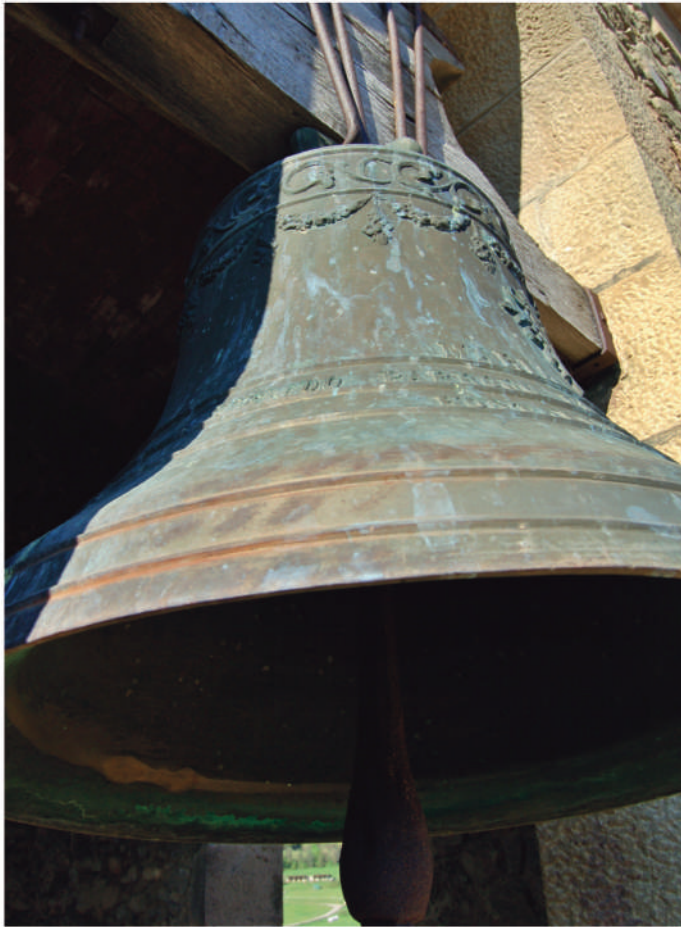
Campana gran dels Hostalets d'en Bas, fosa l'any 1940 per la foneria Barberí d'Olot.