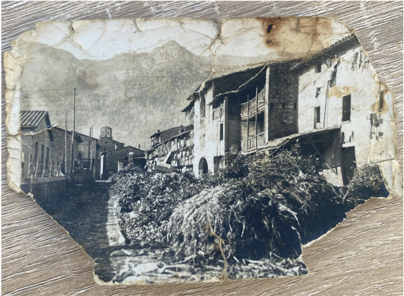
L'antic campanar d'espadanya de Santa Maria dels Hostalets d'en Bas als anys quaranta, vist des del carrer Teixeda.